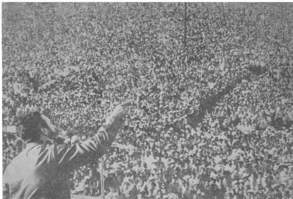
El Primer Ministro Fidel Castro pronunciando un discurso, el 2 de septiembre de 1960, en un mitin, en que fue aprobada la famosa Declaración de La Habana

cian altamente, y un crítico la describe como "un poema espléndido lleno de imágenes heroicas".