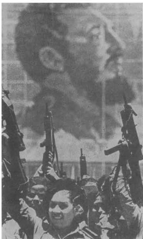
"¡Fidel, seguro, a los yanquis dales duro!"