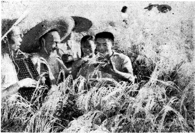
Die Bauern von Szetschuan prüfen die gute Reisernte

Bessere Betriebsführung, weitere Anwendung verbesserten Saatguts und eine verbesserte landwirtschaftliche Technik, mehr Maschinen und Düngemittel und ausgedehntere Be- und Entwässerungsanlagen sind einige von den Faktoren, die hinter den reichen Ernten in diesem Jahre stehen. Wasserregulierungsprojekte, die seit 1958 ausgeführt wurden, beschränken die von Überschwemmung oder Dürre heimgesuchten Gebiete auf das Geringste in den vergangenen Jahren und halfen die Anbaufläche des Landes mit beständig hohen Erträgen zu mehren. All dies hebt die Vorteile eines großangelegten, kollektiv organisierten Landwirtschaftsbetriebes durch die ländlichen Volkskommunen deutlich hervor.