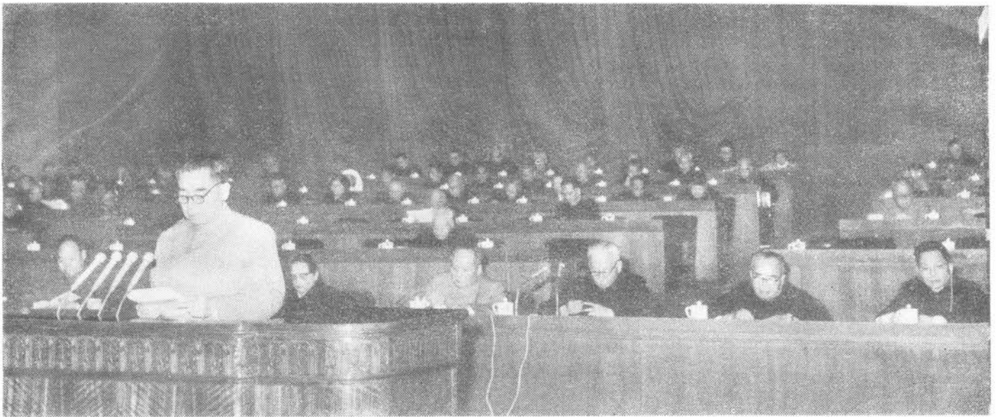
Ministerpräsident Tschou En-lai erstattet seinen Bericht über die Tätigkeit der Regierung

A uf der ersten Tagung des III. Nationalen Volkskongresses am 21. und 22. Dezember 1964 erstattete Ministerpräsident Tschou En-lai im Namen des Staatsrates den Bericht über die Tätigkeit der Regierung.